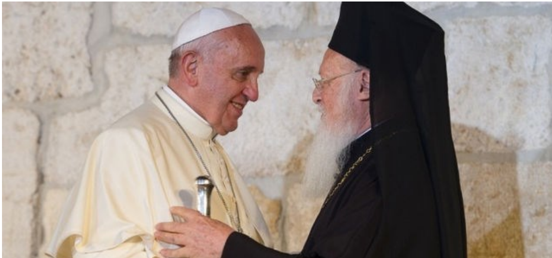
Plaza de San Pedro, 3 diciembre 2014

México, Paraguay, Bolivia, Chile y otros países latinoamericanos. Que la preparación del nacimiento del Señor, en este tiempo de Adviento, les haga crecer en el amor a Jesús y en el deseo de comunicarlo a los demás. Muchas gracias y que Dios los bendiga a todos.